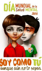
Il·lustració del Dia Mundial de la Salut Mental 2016 del moviment associatiu reunito en SALUD MENTAL ESPAÑA

A nivell estatal la Confederación Salud Mental ha llençat el seu lema " Soy como tu aunque aún no lo sepas ", escollit per votació popular, i concentrarà les seves activitat el dia 10 d'octubre.